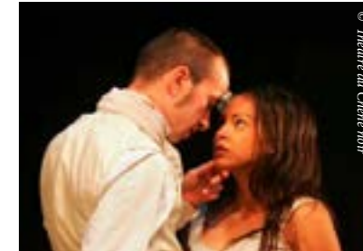
On ne badine pas avec l'amour d'Alfred de Musset