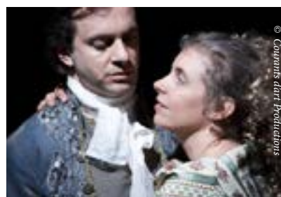
Les Liaisons dangereuses d'après Choderlos de Laclos