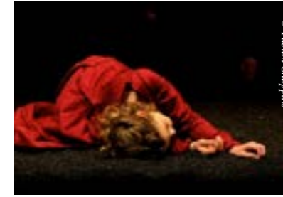
Marie Stuart de Friedrich Schiller