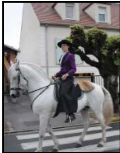
Animation équestre par l'association Les Attelages de Coye lors du 31e Festival

Depuis sa création, le Festival Théâtral de Coye-la-Forêt vise à apporter au plus large public toutes les formes de théâtre. Enfants ou adolescents, familles et/ou amoureux du théâtre peuvent ainsi découvrir des mises en scène novatrices.