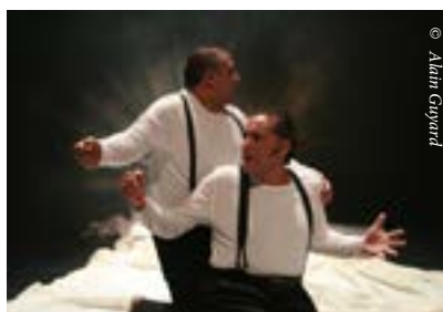
Sacco et Vanzetti