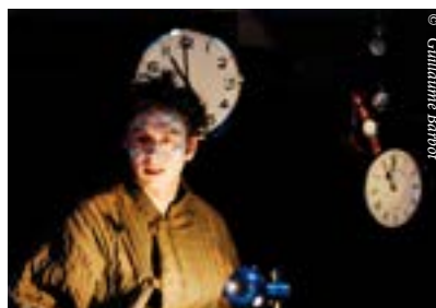
L'Evasion de Kamo de Daniel Pennac